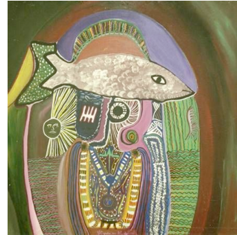
3 Stevenson Magloire, L'homme Poisson, 1987,