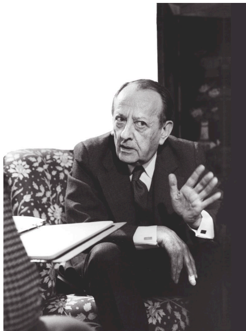
1/ André Malraux par Roger Pic © ADAGP Paris 2009