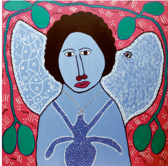
1 Denis Smith, Femme bleue, 1988. © DR acrylique sur toile, © DR

Visuels libres de droits dans le cadre de la promotion de l'exposition disponibles par mail