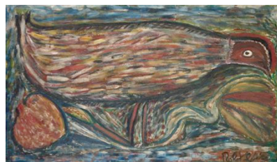
7. Robert Saint-Brice, Oiseau