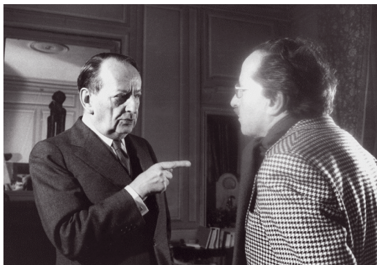
4. A. Malraux, par Roger Pic. © Adagp Paris 2009