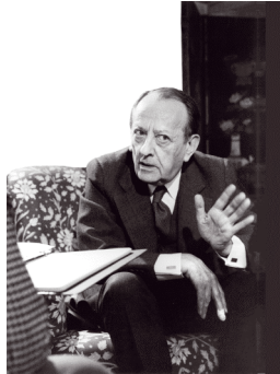
2 A. Malraux par Roger Pic. © Adagp Paris 2009