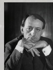
Exposition André Malraux