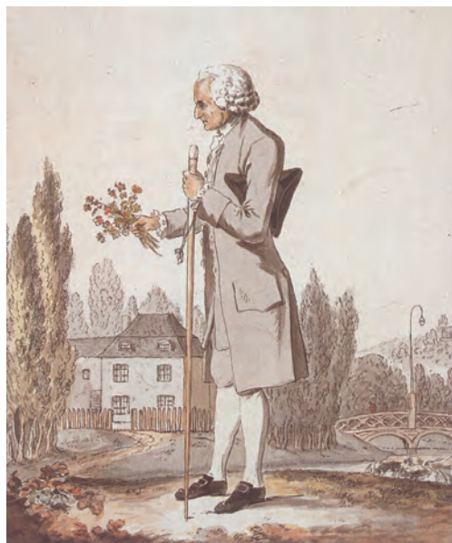
L'auteur des Confessions devant le pavillon qu'il habitait à Ermenonville.