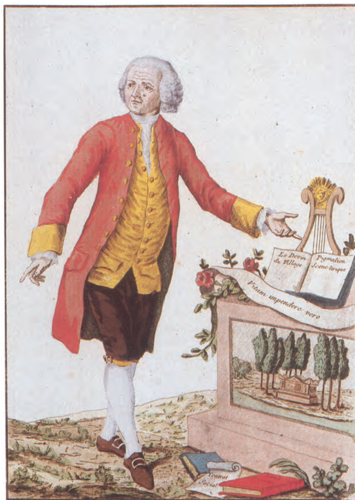
Âgé de 66 ans, Rousseau est représenté ici entouré de ses œuvres : le Devin du village, Pygmalion, le Contrat social et l'Émile.

L'édition est proposée sous forme de volumes reliés ou brochés – à un prix accessible à toutes les bourses – ou en version électronique. Chaque volume comportera une importante iconographie, en noir et en couleur : estampes, frontispices, partitions, herbiers, portraits et documents divers. Cette iconographie se présentera in- et hors texte, sous forme de cahiers.